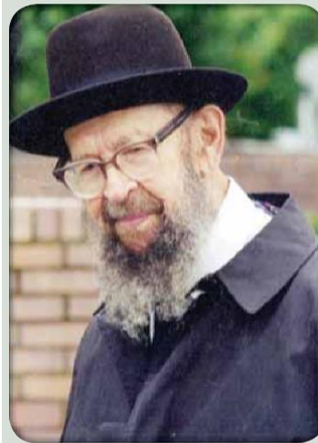
R' Avigdor Miller

A Yid also has to step forward in Tefila and present his case to Hashem, and spell out all his aches and pains in Ruchaniyus and in Gashmiyus . Of course, he has to start with praising Hashem (notice how Yehuda started off with Yosef giving him loads of Kavod , like it says: כִּי כְמוֹךָ כִּפְרָעָה מִדֵּי: You are like Paroh , i.e., you are as great as a