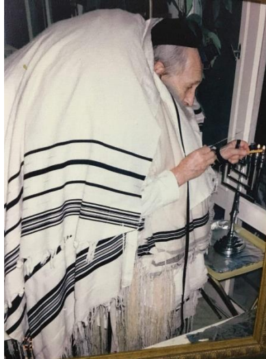
R' Chaim Pinchos Scheinberg lighting the menorah

severely reprimanded one of his favorite Talmidim for saying over a Maharal at a Vaad instead of saying over his own Chidushei Torah . The secret of my Bitachon Weekly was a Vaad in Novardok